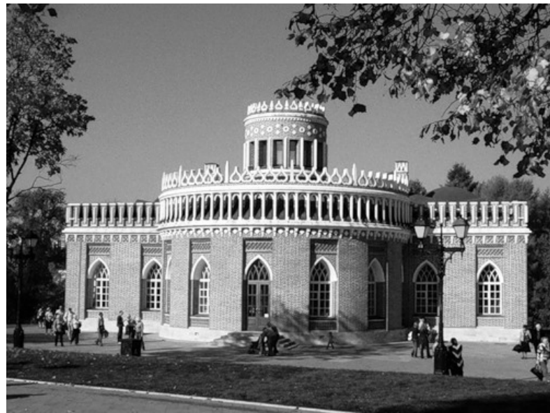
Новый тоннель на Ленинградском шоссе.