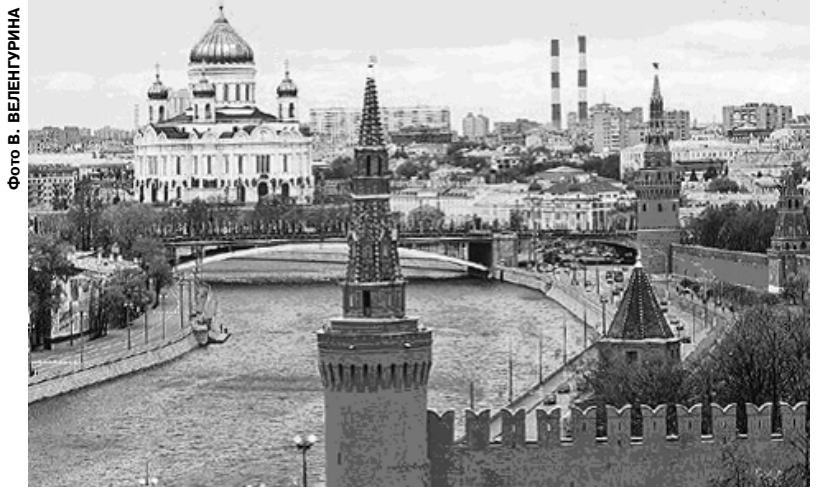
Архитектурный стиль Москвы удивителен и уникален. Древние храмы и новостройки стоят рядом и неплохо смотрятся.

— Сейчас мы разработали проект на два участка Китайгородской стены. Первый участок — по Китайгородскому проезду стена дойдет до Москвы-реки и завершится башней. Второй участок — от Ильинки до Варварки с воссозданием одной башни, которая там была. Остальное сложнее. Особенно в районе магазина «Детский мир». Там Ки-