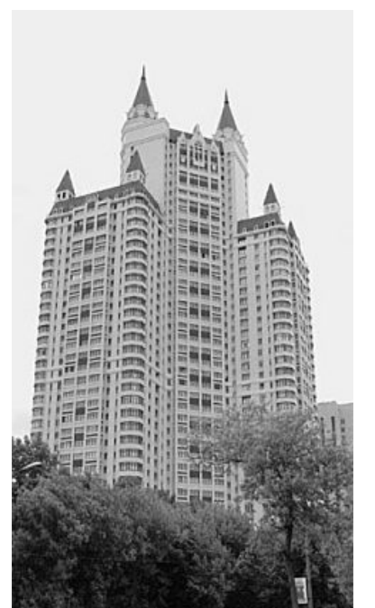
«Эдельвейс» — единственный завершенный объект Нового кольца Москвы.

людей, которые контролируют, чем тех, которые создают. Конечно, есть архитектурный совет, общественный градостроительный совет при мэре Москвы. А главное — законодательство. Ведь любой совет — это тоже субъективизм в той или иной мере. Даже коллективный субъективизм. Я сам веду архитектурный совет, и заметил такую вещь: плохому проекту архитектурный совет помогает стать лучше, а хороший, случается, доводит до среднего уровня. Так что архитекту-