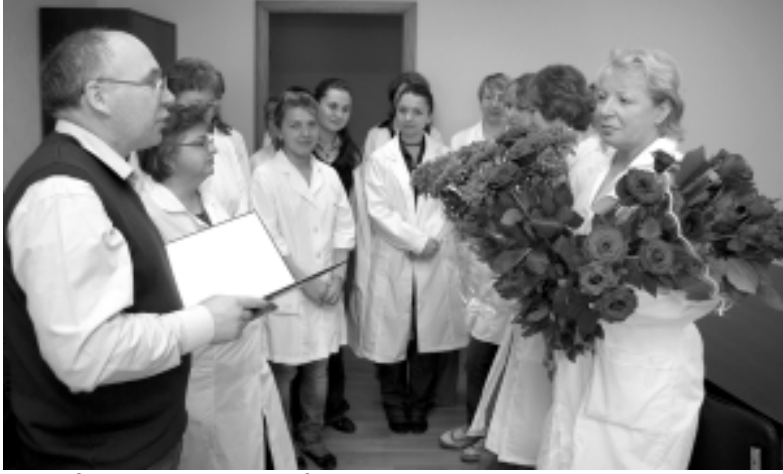
Окончание, начало на стр. 3