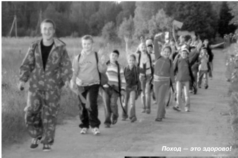
Поход — это здорово!

4 октября президиум Московской Федерации профсоюзов объявил об итогах смотра—конкурса загородных оздоровительных лагерей «Московский марш отрядов «Город доброй надежды, моя Москва», посвященного 860-летию основания столицы нашей Родины и Году ребенка. «Юный метростроевец», как и в прошлые годы, вошел в число призеров, отмеченных дипломом президиума МФП и ценным подарком — караоке.