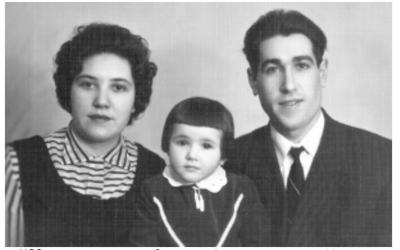
Семейный портрет. 1961 год.

А то, бывало, и ночью срывался. Или срывали, как, например, было на Рижском радиусе, где СМУ-2 соорудило отрезок перегонного тоннеля