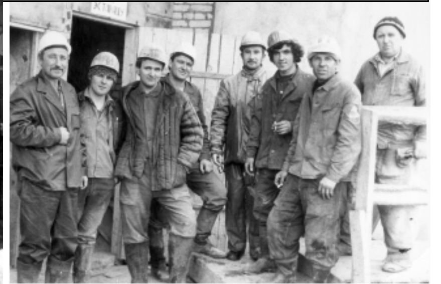
На 609-й шахте, на строительстве станции «Шоссе Энтузиастов».