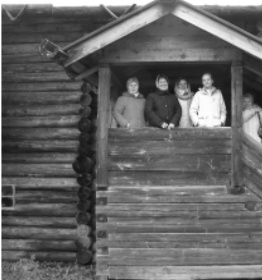
В музее деревянного зодчества. Убранство деревенской горницы.