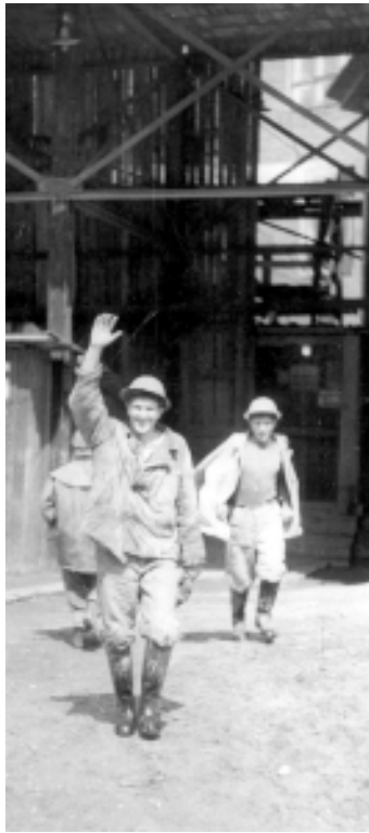
На «Таганской». 1965 год.